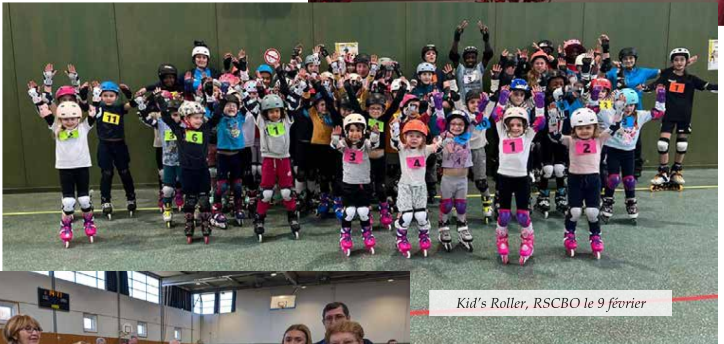
Kid's Roller, RSCBO le 9 février