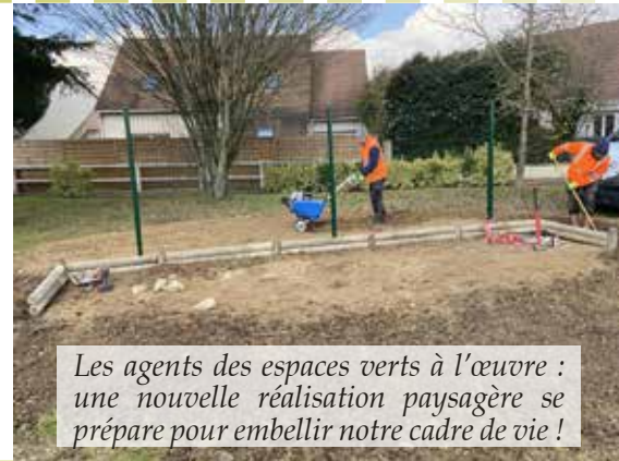
Les agents des espaces verts à l'œuvre : une nouvelle réalisation paysagère se prépare pour embellir notre cadre de vie !

Un peu de patience sera nécessaire avant de pouvoir admirer ce joli tableau vivant, où fraîcheur et couleurs se mêleront harmonieusement, contribuant ainsi à l'embellissement de notre commune pour la saison à venir.