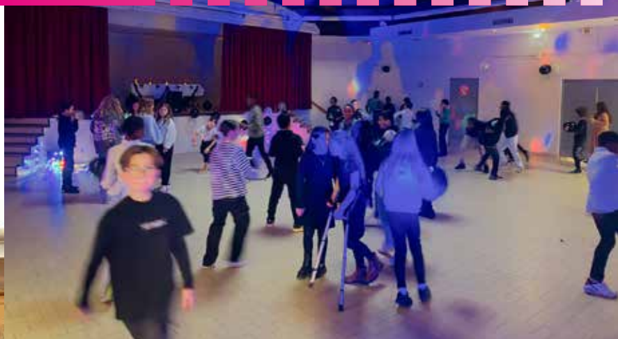
Boum du Comité de la Jeunesse le 21 décembre