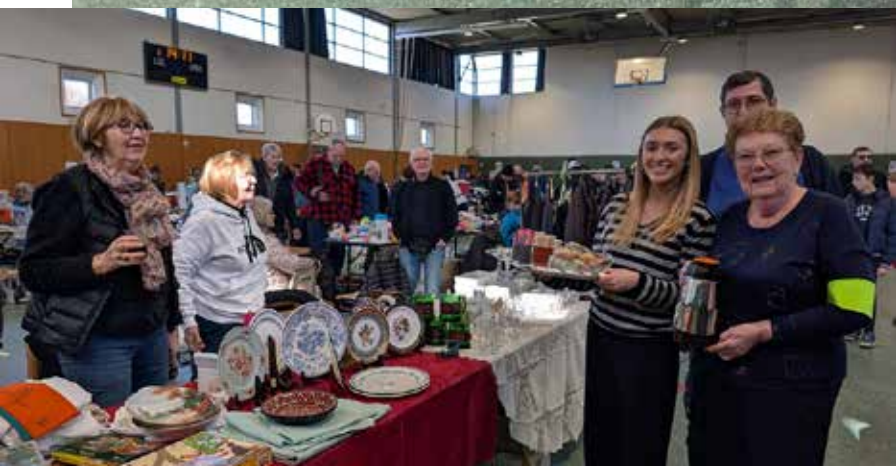
Vide-greniers Broc'hiver le 2 mars