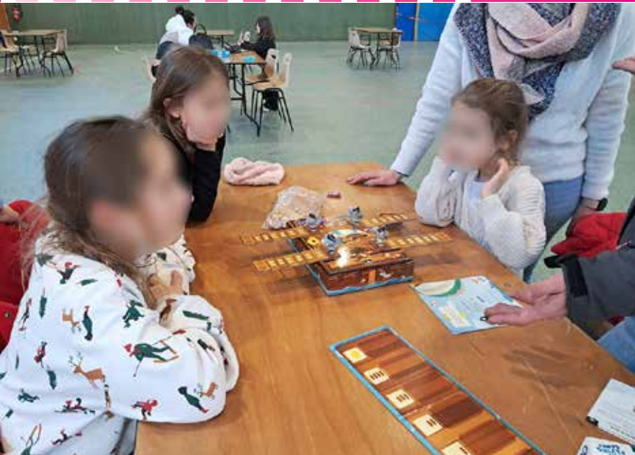
Après-midi jeux de société, organisé par les Parents d'élèves le 2 février