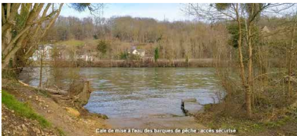
Café de mise à l'eau des barques de pêche - accès sécurisé