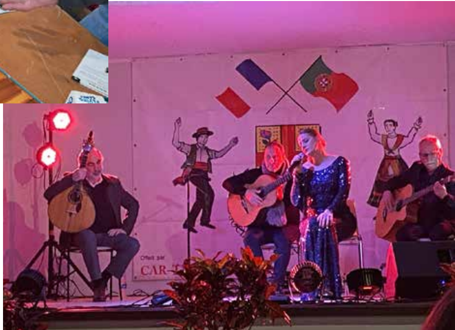
Soirée Fado, Association Franco-Portugaise le 8 février