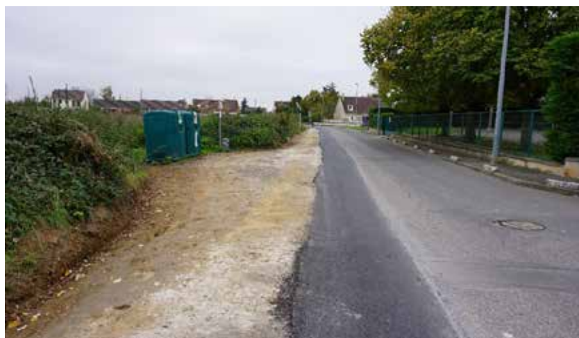
Rue de Faronville face à l'école de Château Villard Rabotage du trottoir pour une meilleure infiltration des eaux de pluie et reprise de la bordure de la rue.