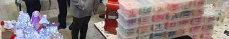
Vernissage de l'Exposition Groupement d'artistes indépendants le 7 décembre