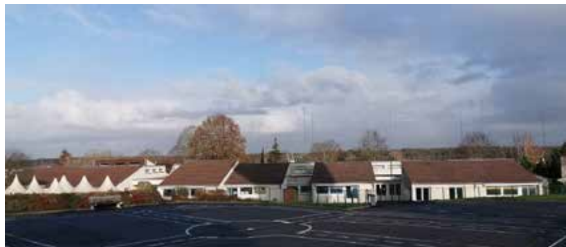
Après nettoyage et traitement antimousse