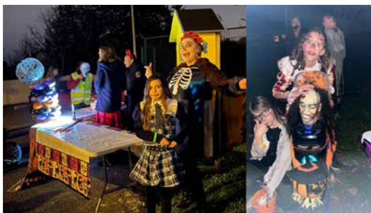
Défilé Halloween organisé par l'association des Parents d'Élèves école Malraux le 31 octobre