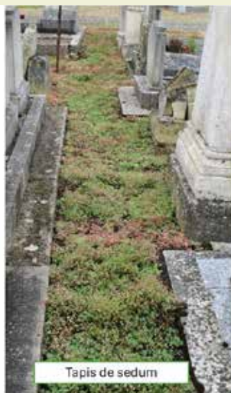
Tapis de sedum