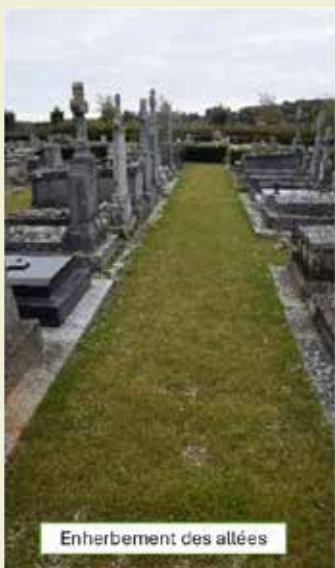
Enherbement des allées