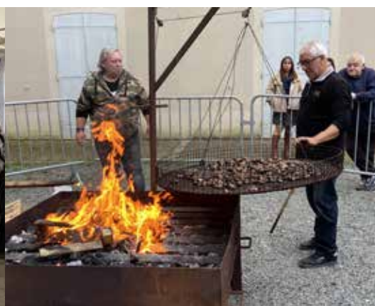
Fête de la Saint Martin le 10 novembre