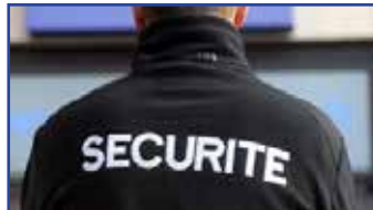
TABLEAU DE BORD POLICE MUNICIPALE

Plus d'informations sur www.service-public.fr/particuliers/vosdroits/F870