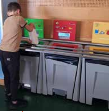
TABLE DE TRI

L'équipe du service périscolaire mène, depuis septembre 2020, une action anti-gaspillage au niveau de la restauration scolaire. Une table de tri a été installée dans le restaurant scolaire de l'école André Malraux il y a un an, c'est au tour du restaurant de l'école Château Villard d'être équipé de ce matériel.