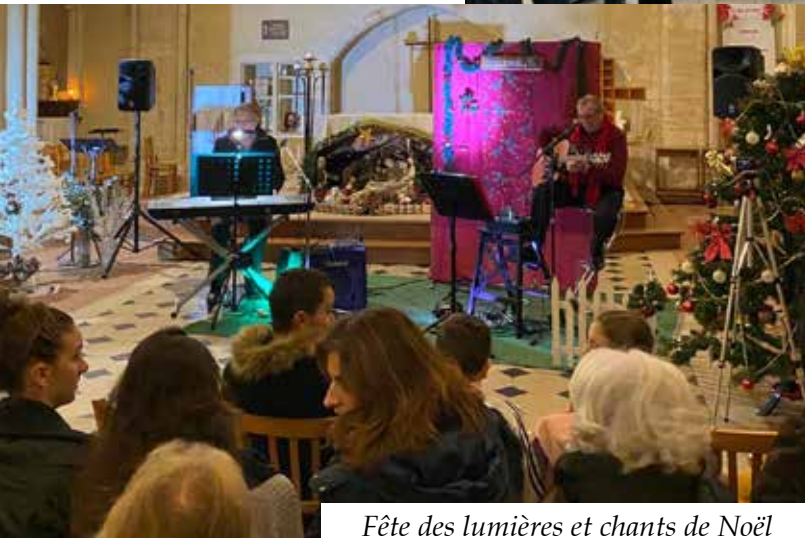
Fête des lumières et chants de Noël le 14 décembre.