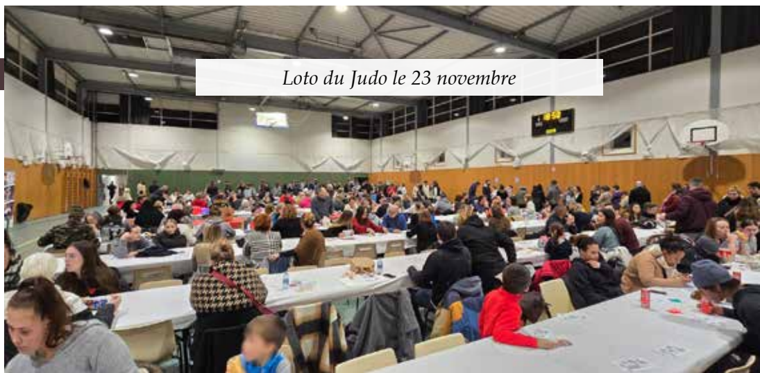
Loto du Judo le 23 novembre