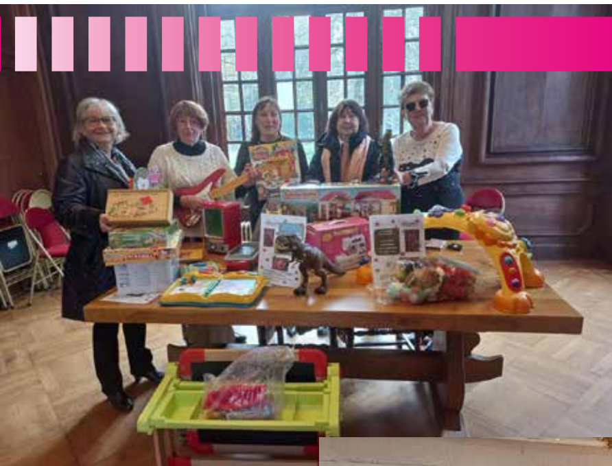
Collecte de jouets CCAS et Solidarité Bébé le 30 novembre