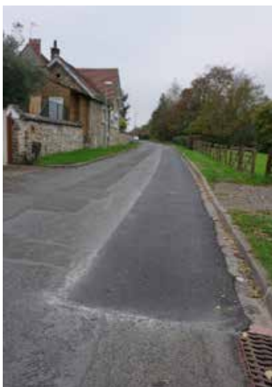
Boulevard de Seine