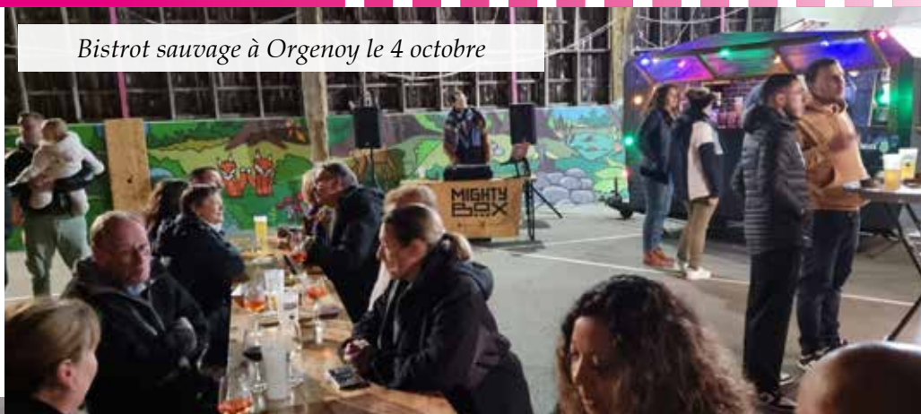
Bistrot sauvage à Orgenoy le 4 octobre