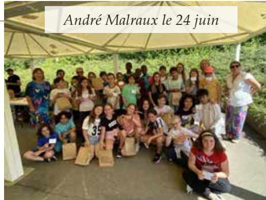
André Malraux le 24 juin