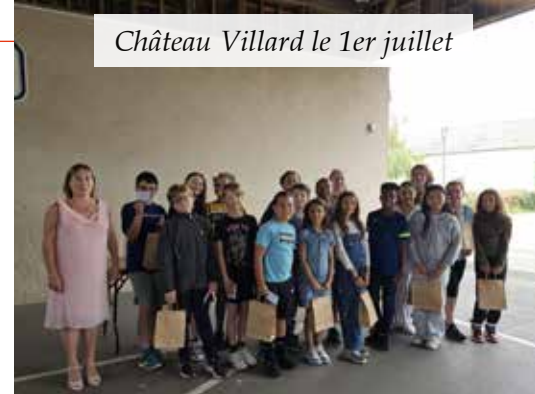
Château Villard le 1er juillet

L'année scolaire 2023-2024 s'est clôturée par la remise des prix pour les élèves de CM2 qui se sont vus remettre une calculatrice pour leur entrée au collège ainsi qu'un roman, offerts par la municipalité. Un permis piéton ou permis vélo était remis aux enfants de CE2 et CM2 après avoir validé quelques exercices supervisés par nos policiers municipaux.