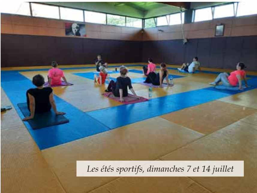
Les étés sportifs, dimanches 7 et 14 juillet