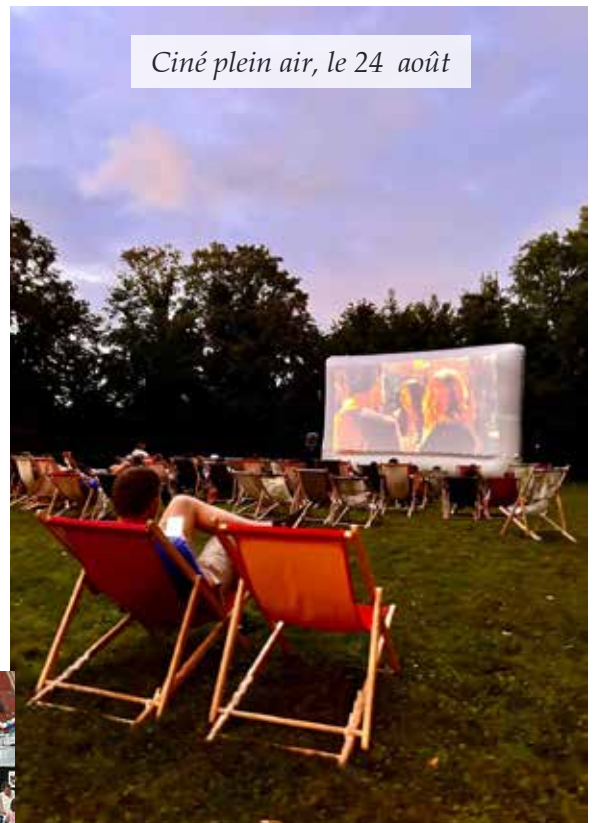
Ciné plein air, le 24 août