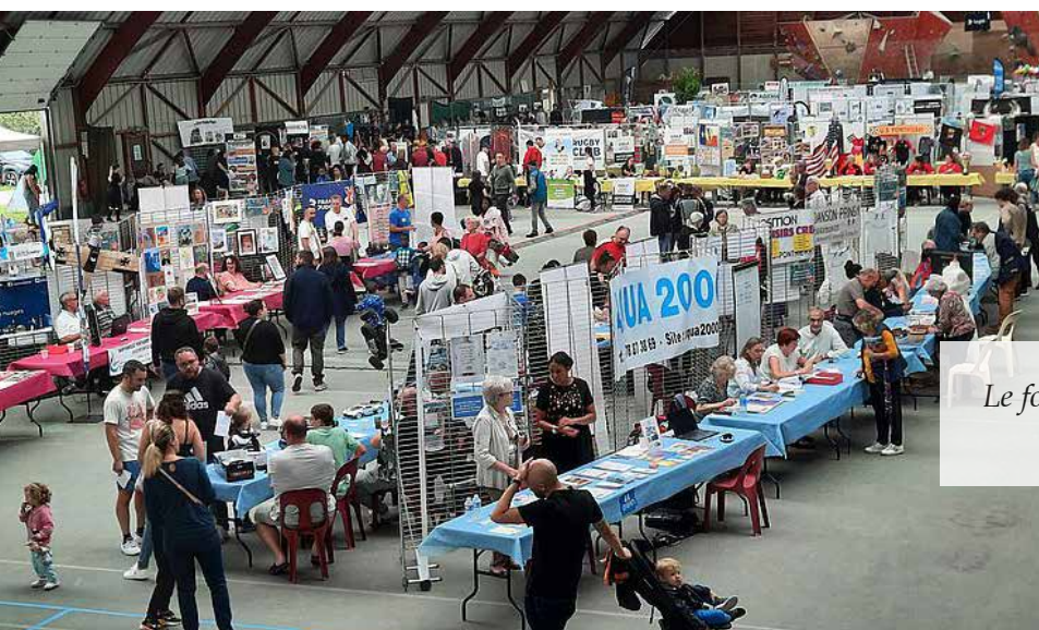
Le forum des associations et du Handicap, le 7 septembre