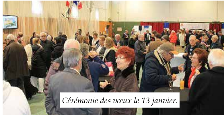
Cérémonie des vœux le 13 janvier.