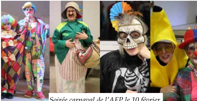
Soirée carnaval de l'AFP le 10 février.