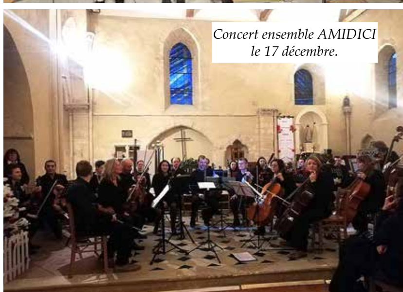
Concert ensemble AMIDICI le 17 décembre.