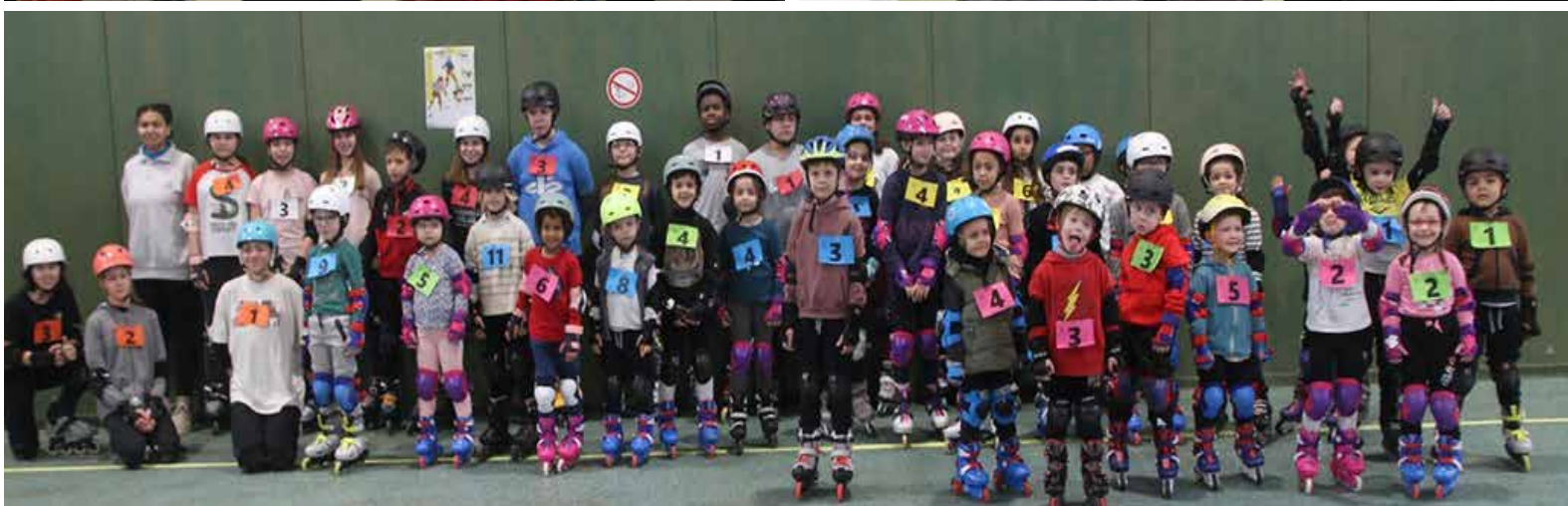
Kids roller du RSCBO le 4 février.