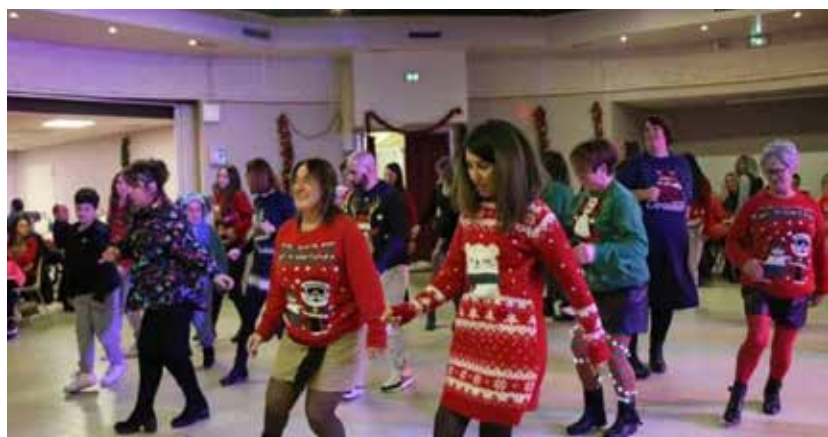
Repas de Noël de l'AFP le 16 décembre.