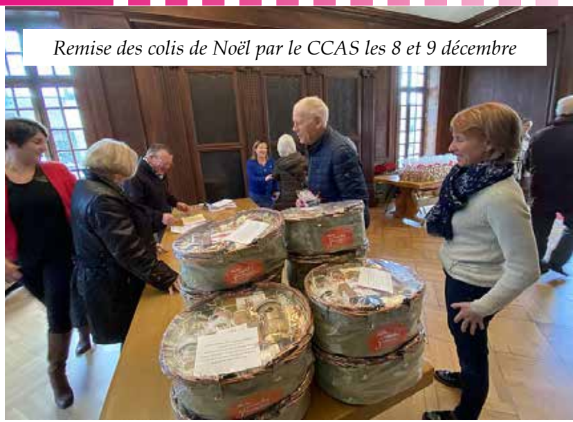
Remise des colis de Noël par le CCAS les 8 et 9 décembre