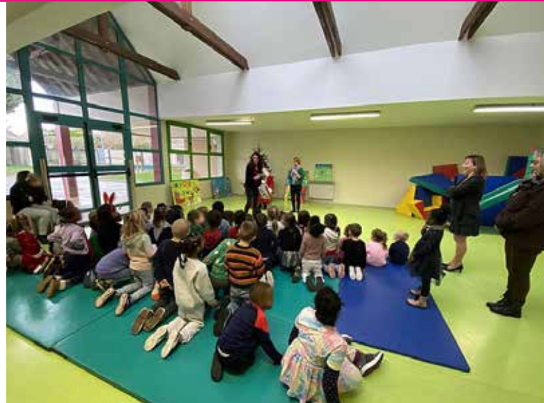
Père Noël dans les écoles le 22 décembre.