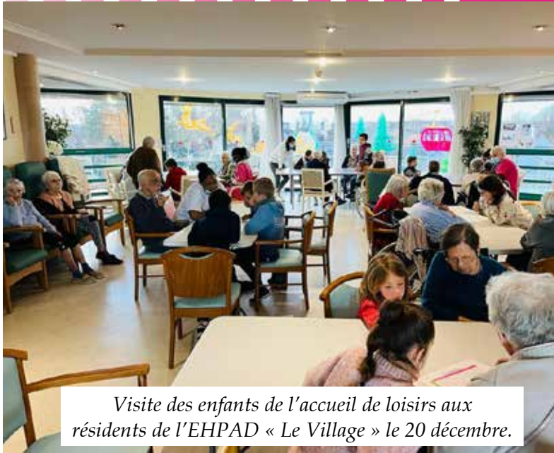
Visite des enfants de l'accueil de loisirs aux résidents de l'EHPAD « Le Village » le 20 décembre.